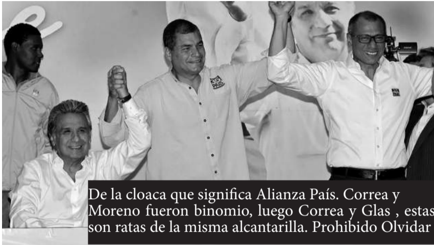
De la cloaca que significa Alianza País. Correa y Moreno fueron binomio, luego Correa y Glas, estas son ratas de la misma alcantarilla. Prohibido Olvidar