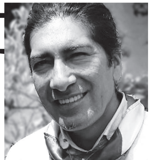
Yaku Pérez Guartambel. Prefecto electo del Azuay

“Como lo hemos venido realizando una actividad en defensa del agua, de la naturaleza, del medio ambiente, desde la Ecuarrunari, desde la CAOI, a pesar de ser brutalmente perseguido por el gobierno de Correa durante los diez años, vamos a continuar en esa misma línea irrenunciable”.